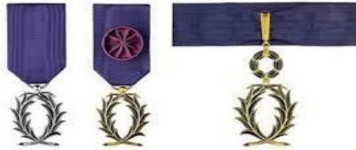
Les trois grades de l'Ordre des Palmes Académiques chevalier, officier, commandeur